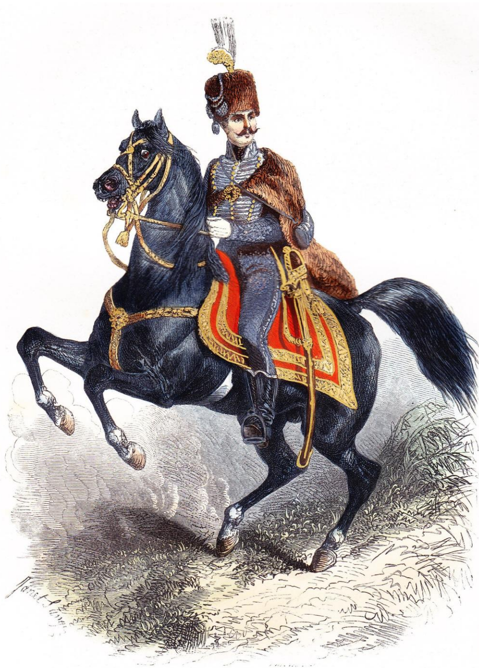
UN HONGROIS EN GRANDE TENUE.